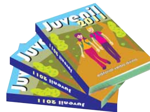
Juvenil 2011 Equipo Editorial Verbo Divino 288 pp. • 8 x 12 cm • rústica ISBN 978-84-9945-108-4