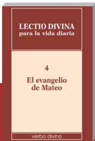
Lectio Divina para la vida diaria El evangelio de Mateo 608 pp. • 13,5 x 21 cm. • rústica ISBN: 978-84-8169-776-6