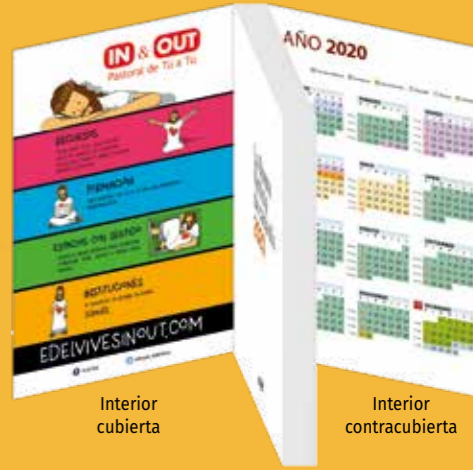
Interior cubierta Interior contracubierta

Consulte condiciones de personalización en ventas@verbodivino.es